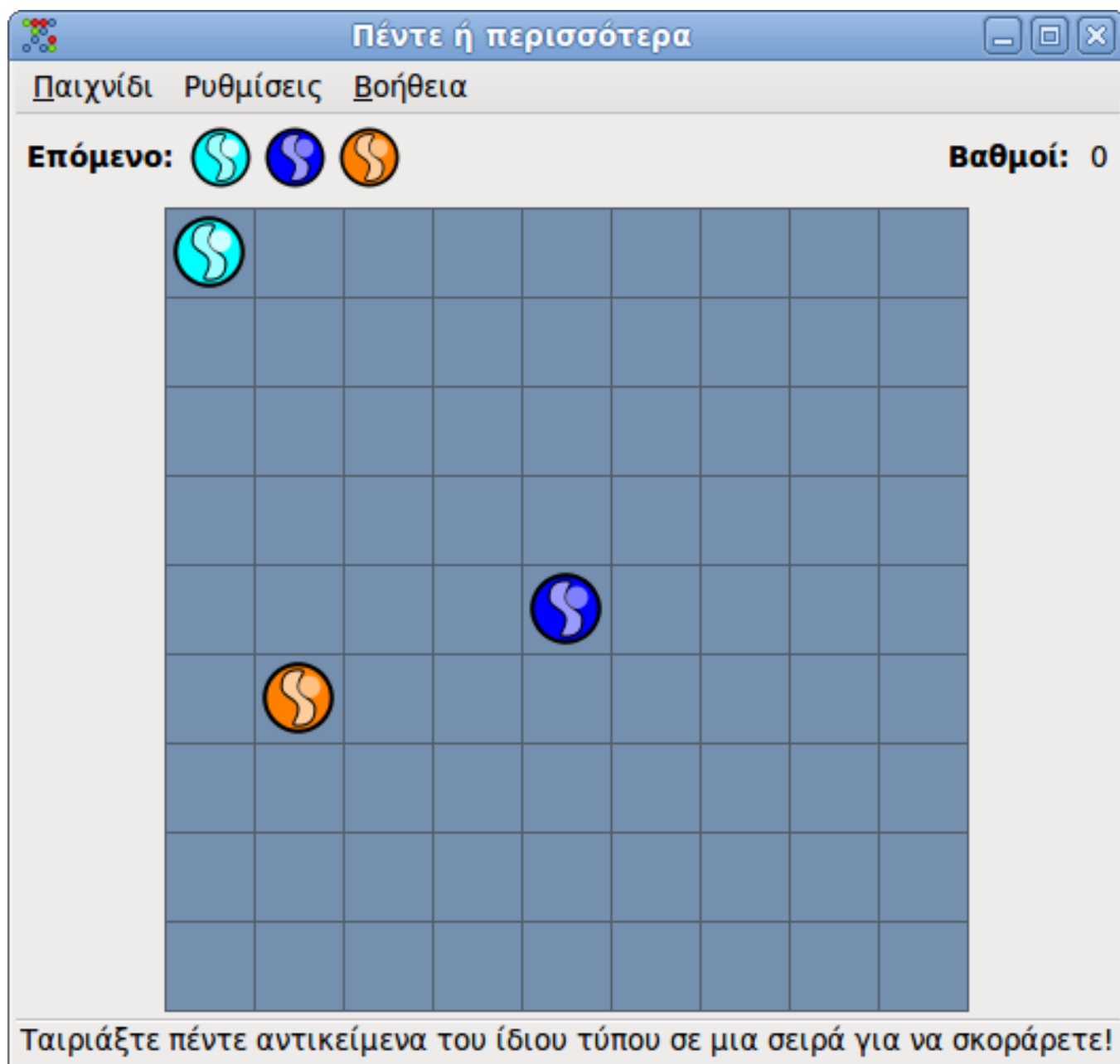
Figure 1: Το κεντρικό παράθυρο όταν ξεκινάτε ένα νέο παιχνίδι.

Καθώς το παιχνίδι προχωράει, το ταμπλό γεμίζει όλο και περισσότερο (εκτός αν είστε πραγματικά καλός...) και η εξαφάνιση των αντικειμένων γίνεται όλο και πιο δύσκολη. Το παιχνίδι τελειώνει, μόλις το ταμπλό γεμίσει.