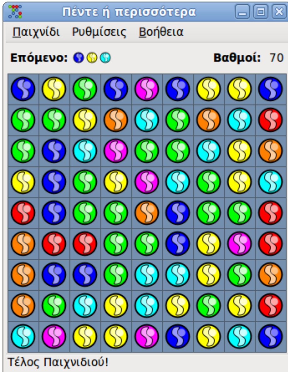
Figure 2: Τέλος παιχνιδιού!