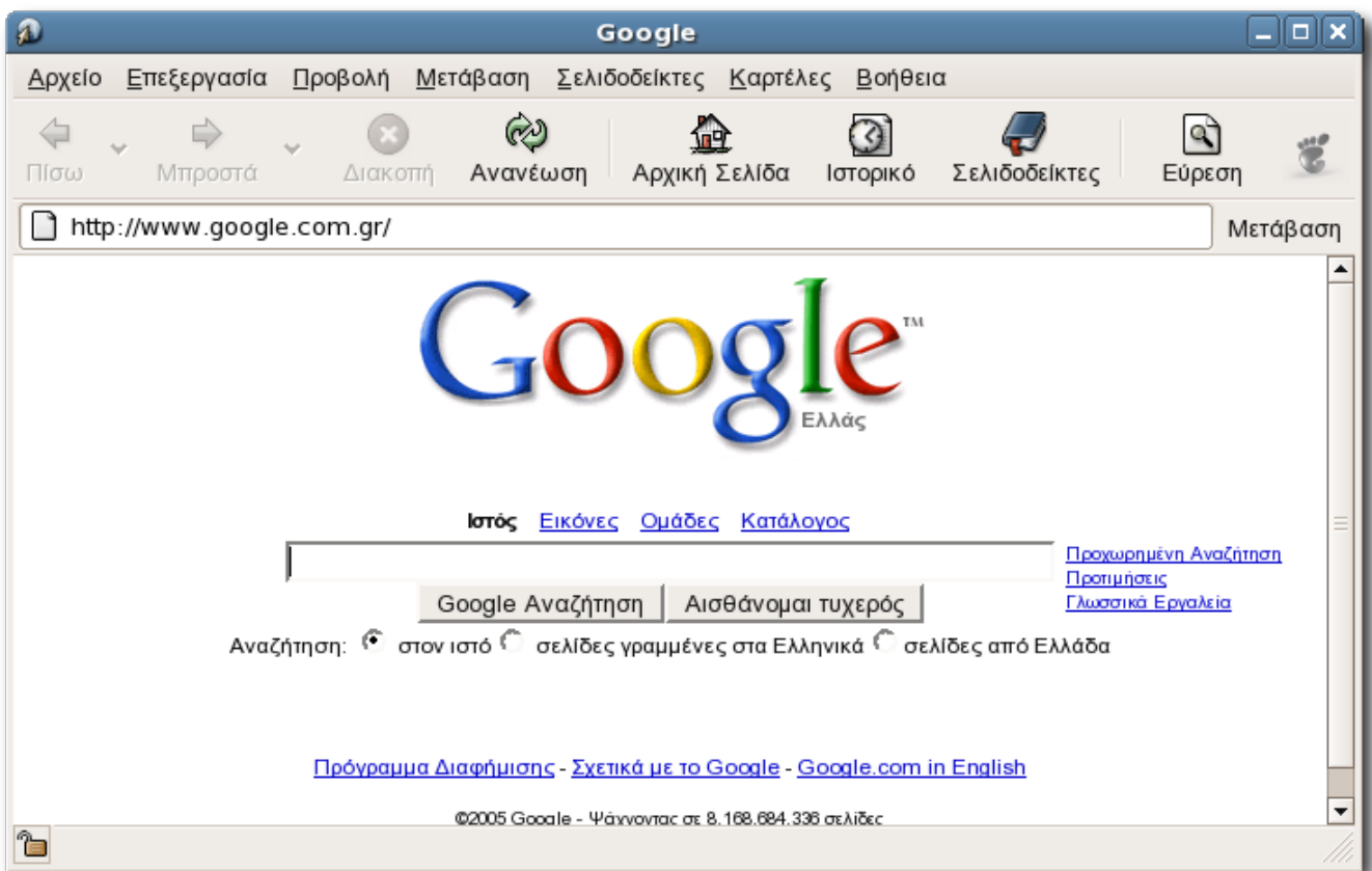
Figure 1: Παράθυρο του περιηγητή με την αρχική σελίδα

Το Table 1 περιγράφει τα περιεχόμενα του παραθύρου του περιηγητή.